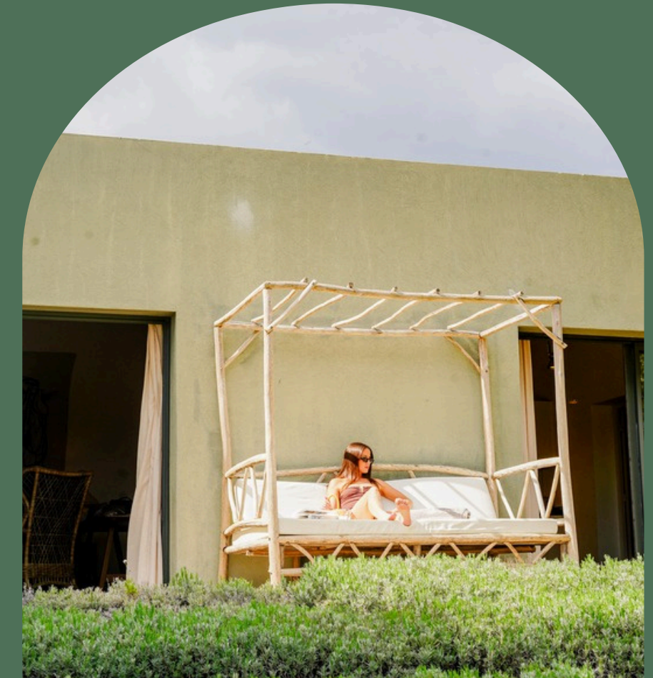
Une villa méditerranéenne

93m 2 avec une terrasse, un grand salon, une salle à manger avec cuisine équipée ainsi qu'une chambre et une salle d'eau