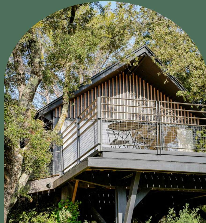
Trois cabanes au design scandinave