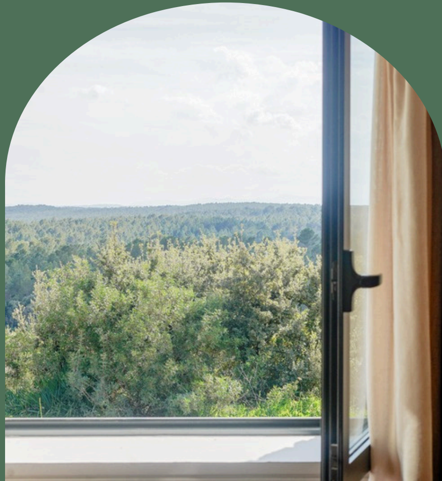
Trois suites avec vue jardin